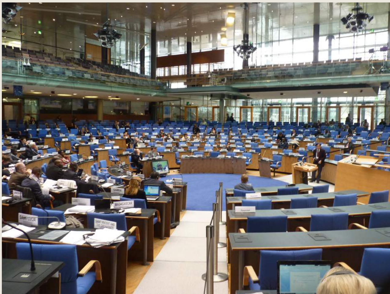
CRIC 9 Bonn

Des informations supplémentaires sur le rôle des organisations scientifiques dans la LCD dans la fiche #7 - " Les réseaux scientifiques de LCD "