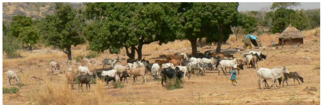
Burkina Faso 2007