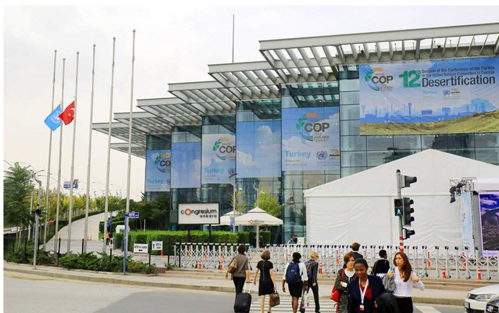
COP12 © UNCCD