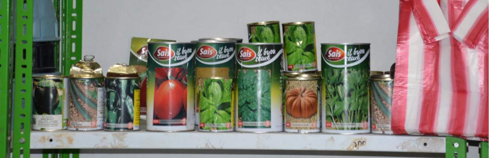
Vente de semence en tant qu'activité de prestation de services