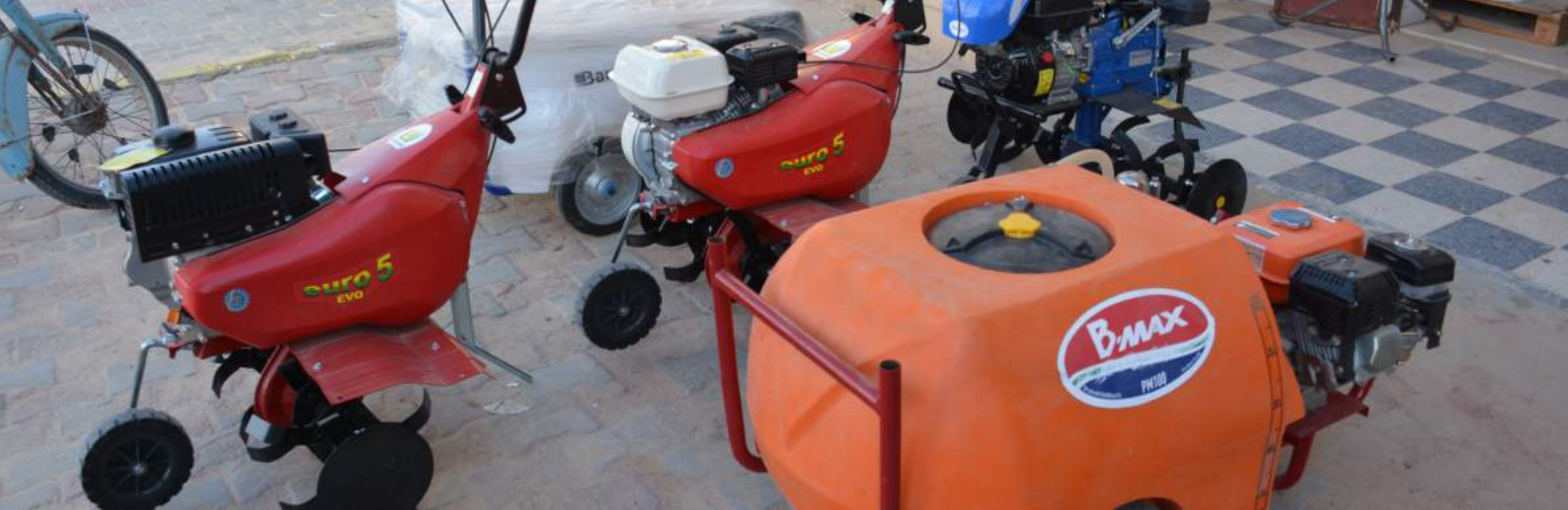
Vente de matériels agricoles en tant qu'activité de prestation de services