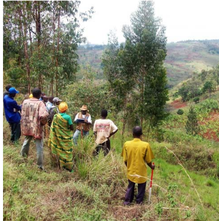
Service foncier communal en train de délimiter un terrain, Commune de Bugenyuzi au Burundi

Conflits et guerres participent à des processus de changements sociaux plus larges, selon des configurations fortement contextualisées dont l'une des particularités les plus marquantes est de trouver à s'incorporer dans la gouvernance globale de l'aide au développement et de la sécurité, en dépit de leur